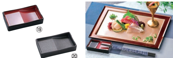
ABS 箸置付長角醤油皿